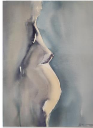
Kerstmis is verwachten